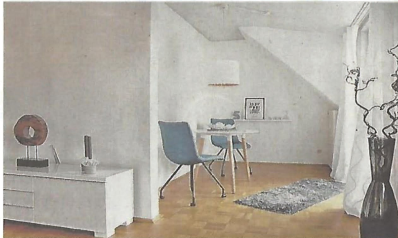
... und so nach dem Home-Staging-Einsatz.

nicht nur ansprechende Fotos, sondern die Kaufinteressenten sehen bei der Besichtigung genau das, was sie auf den Fotos angesprochen hat und fühlen sich beim Betreten der Immobilie wohl“, erzählt Nicole Schütz. Der erste Eindruck und das Bauchgefühl entscheiden in der Regel einen Kauf.